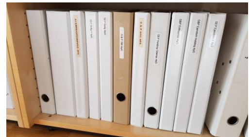
Selskabsmapper i reol

I disse mapper fremgår navne og adresser på de personer der er tilknyttet til de enkelte selskaber.