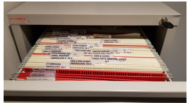
Arkivskab med mapper